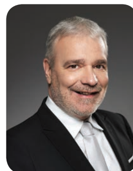
Dan KERSCH Ministre du Travail, de l'Emploi et de l'Économie sociale et solidaire